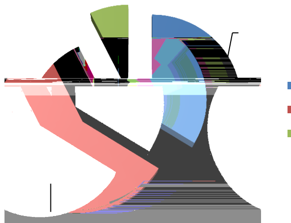
Tabla 6: Fuentes de ingresos para la estrategia 4

El LCAP asigna 8 millones de dólares en fondos de beca complementaria y de concentración, 4,6 millones en ingresos de la beca base, y 1 millón en becas estatales y federales para esta área estratégica.